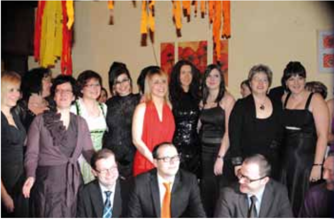
Arbeiterball am 8. Jänner