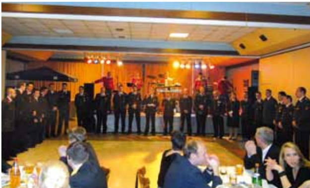
Feuerwehrball am 5. Feber