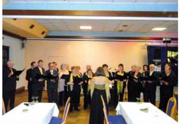
Sängerball am 22. Jänner