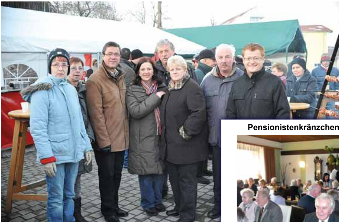
Pensionistenkränzchen am 27. Februar