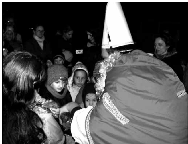
Unten: Wenn der Nikolaus auf den Hauptplatz kommt, ist der Ansturm riesig